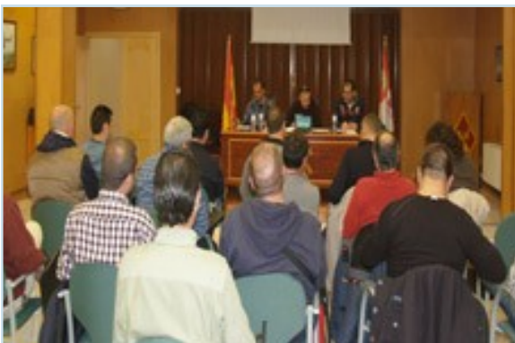
Aspecto de la Asamblea celebrada en Ávila

La asamblea de Cáceres, que se han desarrollado en los salones de sus respectivas comandancia, y ha sido una clara muestra de la cohesión de su Junta Directiva Provincial. Una situación, esta, que ha contrastado con la mala relación con el actual mando responsable de esa comandancia, pues ni tiene, ni quiere la necesaria interlocución con las asociaciones profesionales, y en concreto con la mayoritariamente re-