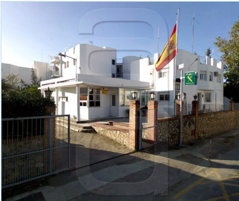
Imagen de la casa casa cuartel de Montilla.

Para AUGC, la situación en la que se encuentran estas dependencias podría incumplir lo dispuesto en la legislación sobre Prevención de Riesgos Laborales, por lo que ya han