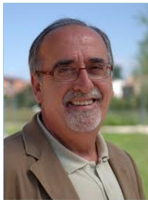
Juan Masa, alcalde de Rivas Vaciamadrid.