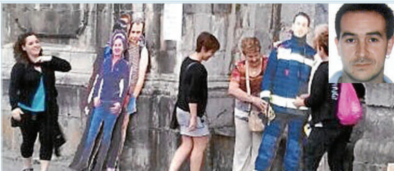
Andoaín, fiestas patronales, como suvenir: fotografiarse con asesinos etarras.

AUGC ha sido la única organización que ha tomado la iniciativa de concentrarse frente a la Lehendakaritza como muestra de apoyo a los compañeros de País Vasco Navarra que estaban siendo acosados por el "mundo abertzale" desde su llegada a las instituciones vascas y navarras de la mano de Bildu.