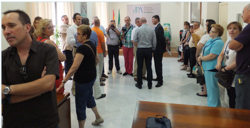
Aspecto del salón donde se realizó el homenaje a las víctimas del Terrorismo.