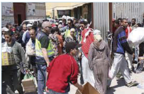
Aspecto de un día cualquiera en el paso Fronterizo de el Tarajal, en Ceuta.

Una muestra de que en el País Vasco y Navarra aún no se puede vivir en libertad es la vergonzante iniciativa llevada a cabo por los abertzales de Andoaín durante sus fiestas patronales. Han ofrecido a sus vecinos y visitantes la posibilidad de tener como "suvenir" una fotografía, a tamaño real, con un asesino etarra del municipio a cambio de 1€. Un nueva humillación de Bildu a las víctimas de ETA. Todo vale para recaudar dinero para su colectivo de presos. Todo menos pedir perdón a los que han sufrido su terror.