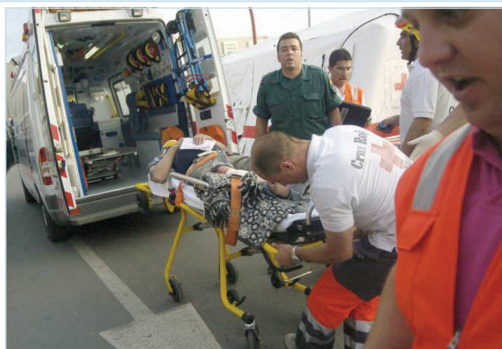
Guardia Civil de Lorca ayudando en el traslado de una víctima del terremoto de la ciudad murciana.

Mientras en la Guardia Civil solo se ha reconocido el gran trabajo realizado a 12 agentes de los 40 componentes del Acuartelamiento de Lorca, más los 50 del destacamento de tráfico. Por todo ello AUGC ha trasladado una carta al Delegado del Gobierno, donde además de exponer el malestar de los guardias civiles se le solicita que realice todas las gestiones necesarias para subsanar lo antes posible este agravio y que todos los componentes, que en el fatídico día del seísmo se encontraban destinados en Lorca y prestaron su inestimable servicio al pueblo de Lorca, sean reconocidos con la medalla de la Cruz al Mérito de la Guardia Civil a todos los