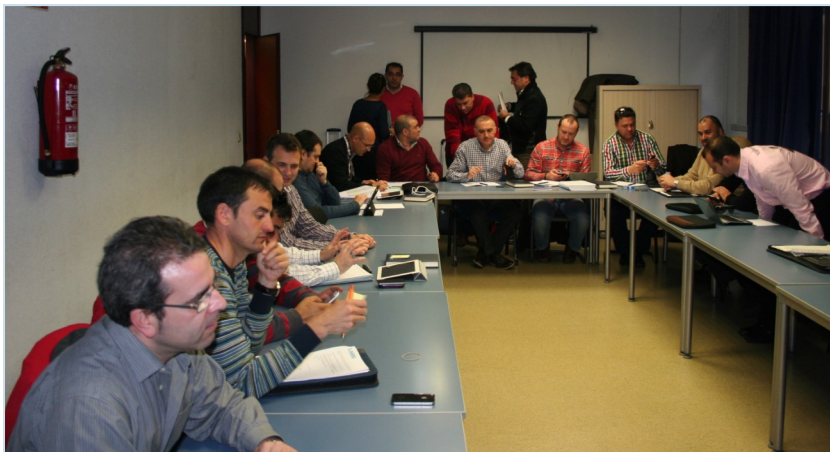
Los representantes federales de AUGC en los momentos previos a la

Las agrupaciones de representantes de cada especialidad que trabajarán en este proyecto serán coordinados a nivel