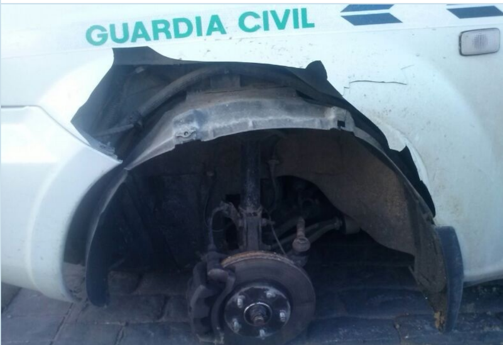
Vehículo del puesto de Ppal. De Humanes, Madrid, accidentado el pasado mes de

En el Puesto Principal de Santa Lucía de Tirajana, de 9 vehículos que tienen asignados las patrullas, cinco están en el taller por distintos motivos. El problema se extiende también al Puesto Principal de Playa de las Américas en el sur de Tenerife, donde de los ocho vehículos, dos se encuentran en el taller, los vehículos más modernos (3) son de uso exclusivo de los mandos y los tres más viejos son utilizados por las patrullas de Seguridad Ciudadana, dando una imagen pésima a los turistas que frecuentan la demarcación.