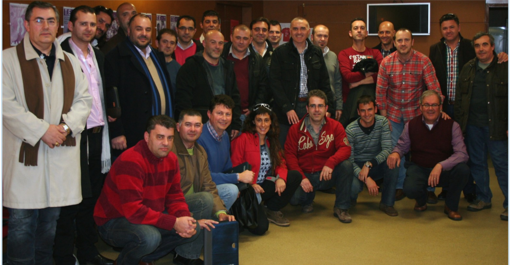
Los asistentes a la Confederal de AUGC junto a los miembros de la JDN.

En este momento el anteproyecto de Ley Orgánica está en fase de ser informado por el Consejo de Estado. Por lo que