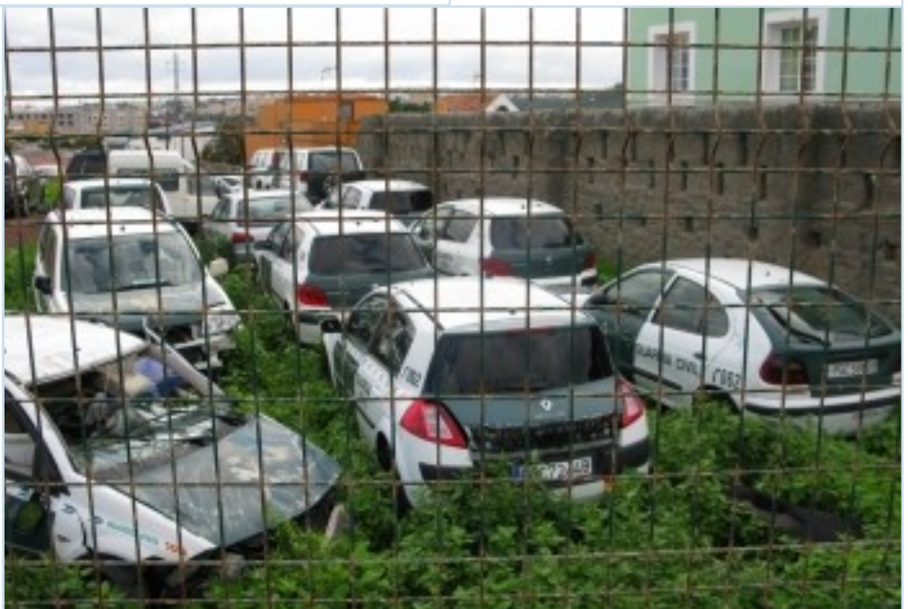
Aspecto del puesto canario con los vehículos averiados.

Pero el resto de vehículos del puesto no están en mejor condición que este como ha podido constatar AUGC Madrid, pues los componentes del puesto tienen que realizar patrullas sin el sistema de luces prioritarias y sonido acústico por estar averiados. Una situación que se