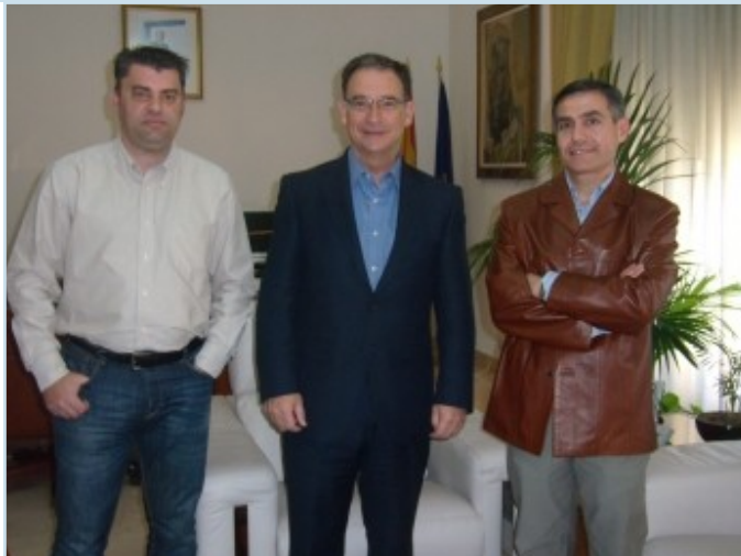
El delegado del gobierno junto a los representantes de